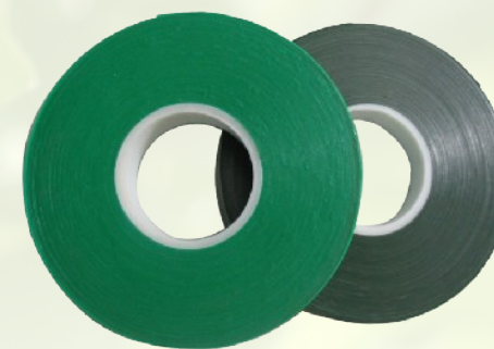
Szalag a kötőfogókhoz 0,1 – 0,15 mm vastagságban 26 ill. 40m -es tekercsben