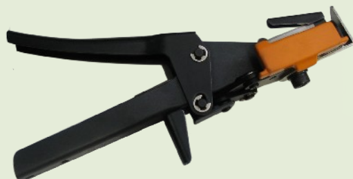
MAX HR-F kapcsoló fogó 3,5 – 4,5 mm vastagságú törzskötözőkhöz