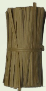
Papír bevonatos lányhuzal kötöző 10 vagy 12 cm-es darabolt