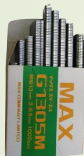
Kapocs kapcsoló fogóhoz