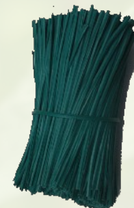
PVC bevonatos lányhuzal kötöző piros vagy zöld színben 10, 12, 15, 25 cm-es, darabolt