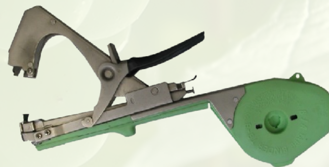
HT-B licenc kötőfogó