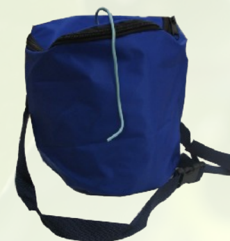
Derékra köthető hordtáska törzskötözőkhöz