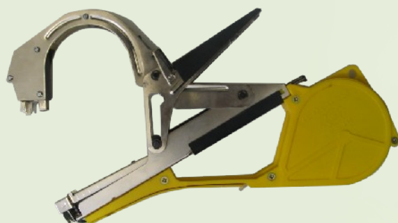
Simes Mod. 145 kötőfogó