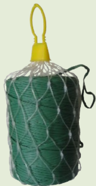
PVC bevonatos lányhuzal kötöző kb 150m tekercsben