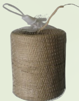
Papír bevonatos lányhuzal kötöző 250m vagy 500 m tekercsben