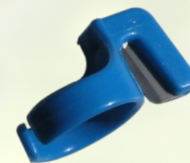
Vágógyűrű törzskötözőkhöz műanyag és fém változatban