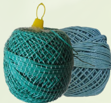
Spanyol ill. olasz műanyag törzskötöző, 2–2,75–3,5-4,5 mm-es vastagságban, egy szálból tekercselve. Súly: 1kg