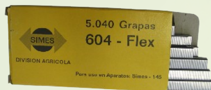
Kapocs kötőfogóhoz 5040 db/dobozos vagy 4800 db/dobozos kiszerezésben